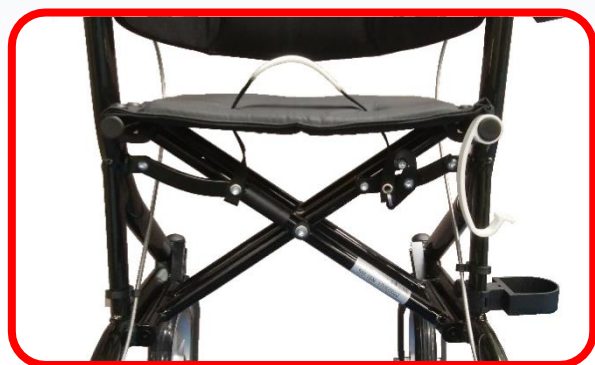
〈ダブルクロスバー〉